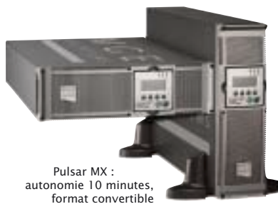
Pulsar MX : autonomie 10 minutes, format convertible tour/rack (3U), synoptique, écran LCD.