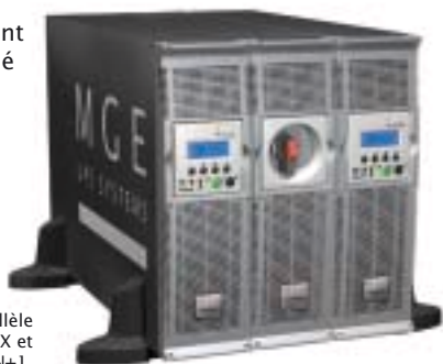
Solution de mise en parallèle (9U), associant 2 Pulsar MX et ModularEasy : 2N ou N+1.

Protection de 20 à 110 serveurs, idéal pour :