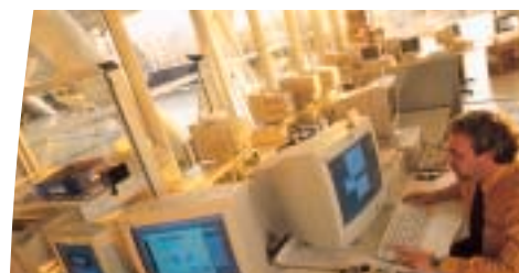
Extension de puissance simple à installer et transparente pour l'utilisateur quand le nombre d'équipements protégés augmente.