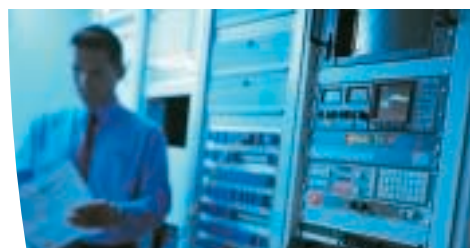
Intégration dans les racks haute densité.