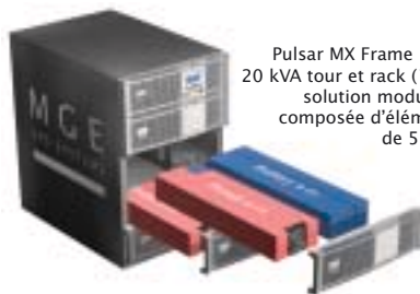
Pulsar MX Frame 15 et 20 kVA tour et rack (16U), solution modulaire composée d'éléments de 5 kVA.