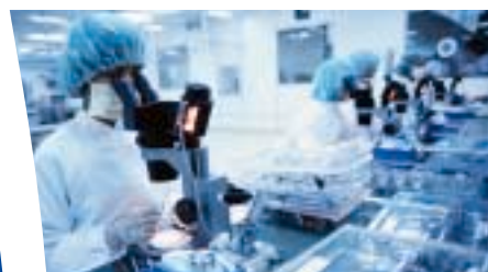
Redondance grâce à la mise en parallèle pour les applications très critiques.